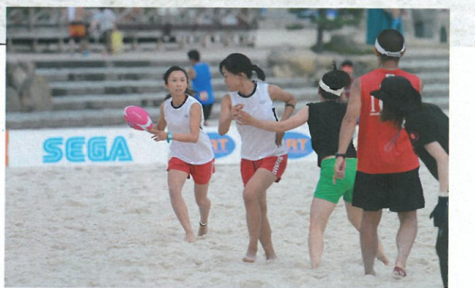
ジャパンツアー2連勝を飾ったBUSAIKU。決勝トーナメントは全試合完封という圧巻の強さを見せた