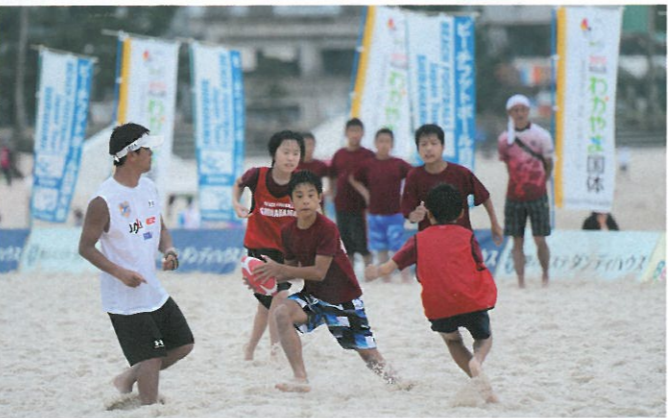
キッズの部決勝は劇団反抗期(大阪)が地元梅干しJr.クラブ牛若丸に勝利した

大阪から参戦し、決勝に進出したteam LUCE。BUSAIKUがすでに東海大会を制しているため、全国大会出場権を獲得した