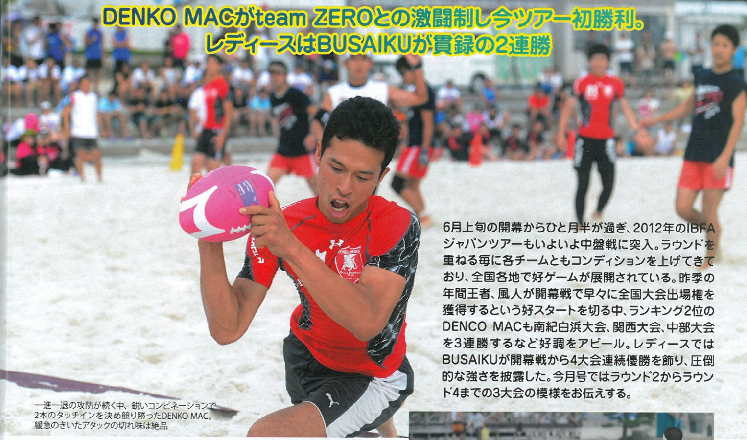
一進一退の攻防が続く中、鋭いコンビネーションで2本のタッチインを決め競り勝ったDENKO MAC。緩急のきいたアタックの切れ味は絶品

DENKO MACがteam ZEROとの激闘制し今ツアー初勝利。 レディースはBUSAIKUが貫録の2連勝