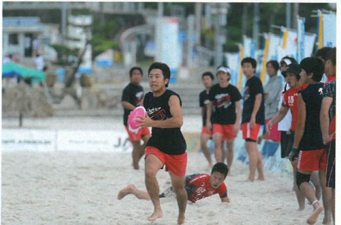
開幕戦に続き優勝チームに敗れたteam ZEROだが、得意のロングフロントパスは健在。今季も優勝争いを振り回せそうだ

6月上旬の開幕からひと半月が過ぎ、2012年のIBFAジャパンツアーもいよいよ中盤戦に突入。ラウンドを重ねる毎に各チームともコンディションを上げてきており、全国各地で好ゲームが展開されている。昨季の年間王者、風人が開幕戦で早々に全国大会出場権を獲得するという好スタートを切る中、ランキング2位のDENKO MACも南紀白浜大会、関西大会、中部大会を3連勝するなど好調をアピール。レディースではBUSAIKUが開幕戦から4大会連続優勝を飾り、圧倒的な強さを披露した。今月号ではラウンド2からラウンド4までの3大会の模様をお伝えする。