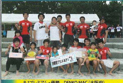
B-1プレミアム・優勝 DENKO MAC (大阪府)