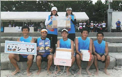
オーバー35・優勝 大阪スーパーモンキーズ (大阪府)