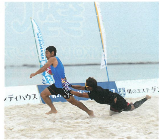
オーバー35の部で大会5連覇を達成した大阪スーパーモンキーズ。女性2名を含む布陣ながらこの快挙は見事

大阪から参戦し、決勝に進出したteam LUCE。BUSAIKUがすでに東海大会を制しているため、全国大会出場権を獲得した