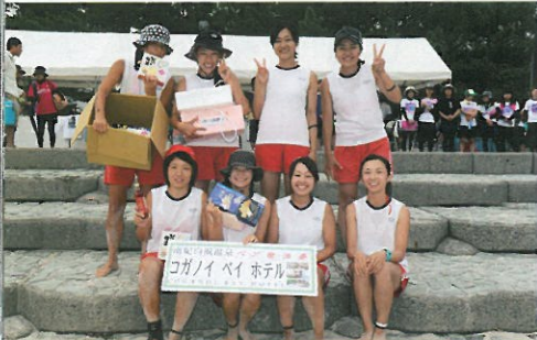
レディース・優勝 BUSAIKU (東京都)